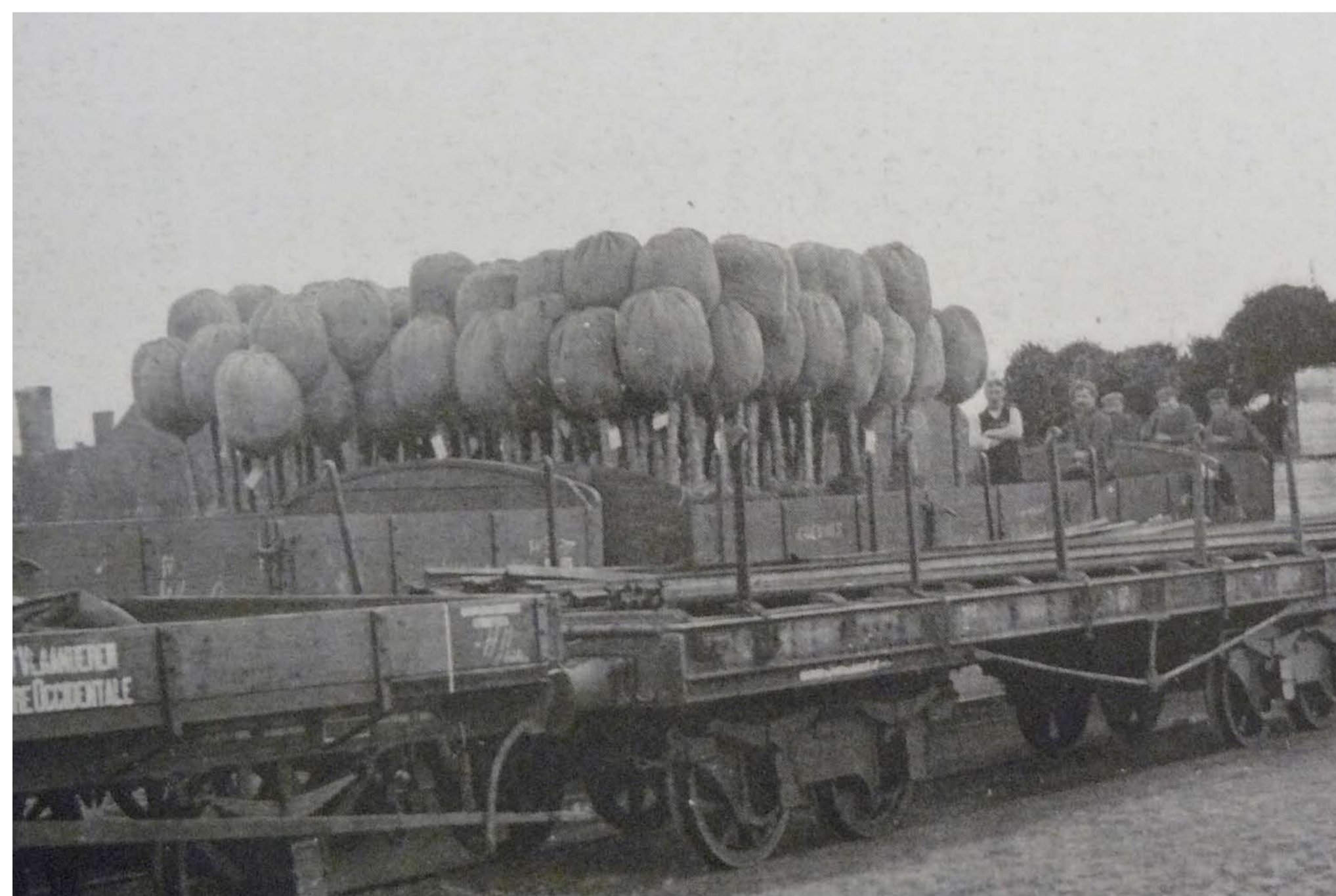
Gezien de Brugse laurier voornamelijk een export product was, lagen de grote laurierbedrijven vaak dicht bij een spoorlijn. De spoorlijn liep a.h.w. door Flandria , Vincke lag eveneens bij een spoorlijn (toen nog Station Brugge Noord) en Sander was uiteraard ook dicht bij een spoorlijn gelegen. Uit informatie ons verstrekt door Mevr. Devisch van Lauricaplants blijkt dat de transportkost voor één wagon van Brugge tot Parijs ongeveer tweehonderd Belgische frank bedroeg in 1871 . Dit was toen gelijk aan de prijs die gemiddeld voor een grote laurier betaald werd. Doc. Provinciale bibliotheek .