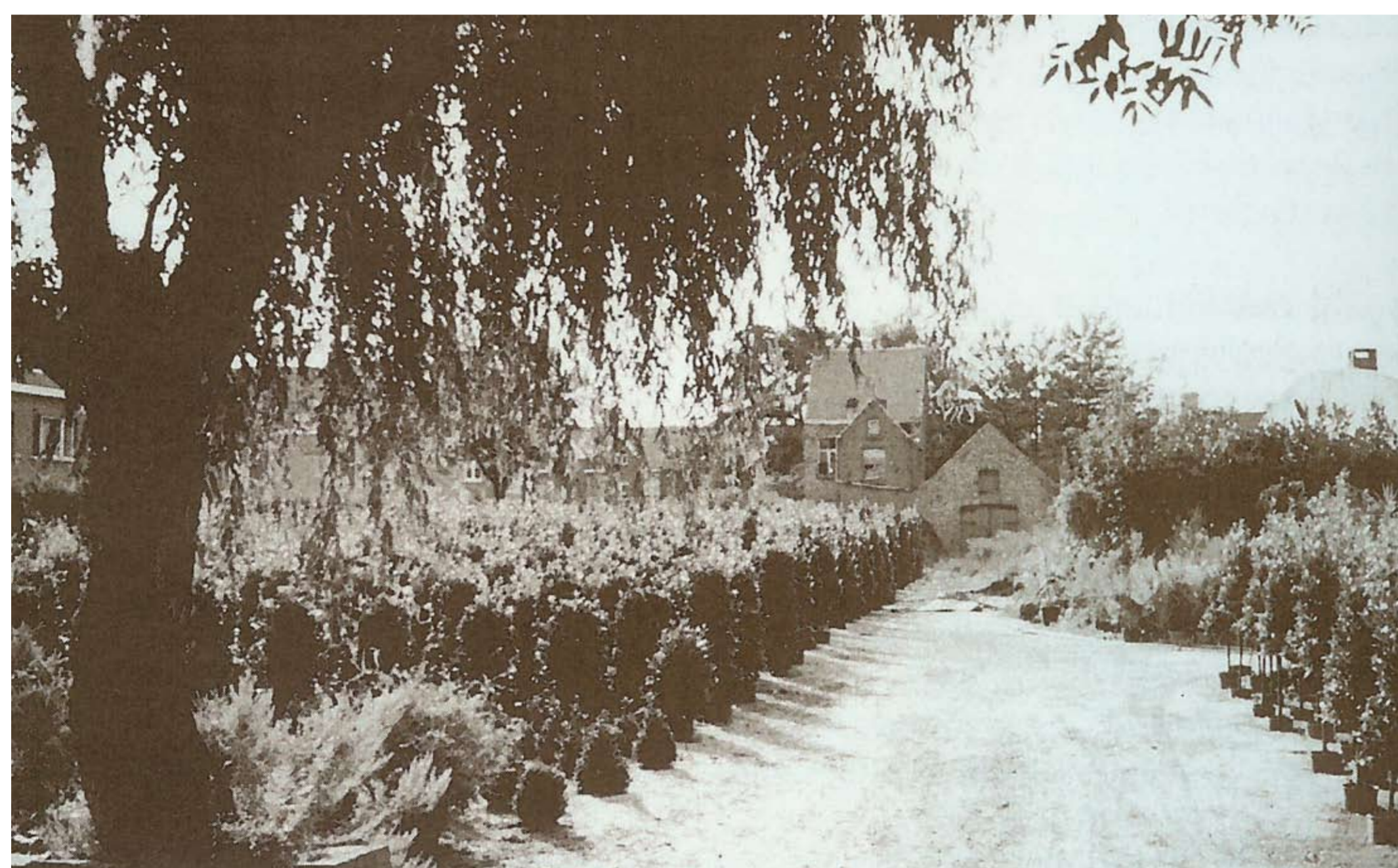
Foto van Tuinbouwbedrijf Coene voor de verkaveling van het gedeelte aan de Van Steenstraat op Assebroek, op de achtergrond het inmiddels gesloopte huis dat C. Coene in 1909 liet oprichten in de Guldenpeerdenstraat. Doc J.Rau