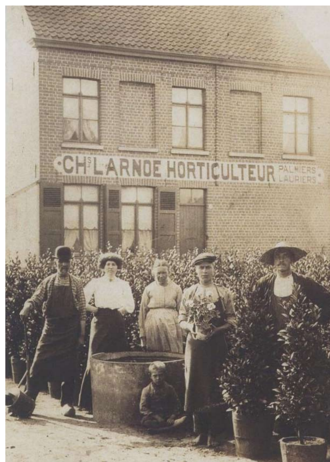
Foto uit 1910 van horticuultuur Charles Larnoe , gelegen aan Lange Vestingstraat te St-Andries. Gebouw verdween bij verkaveling rond 1960-65.

Dankzij de interesse in wintertuinen en oranjerieën werd de statige laurier, met zijn veelvoud aan snoei - vormen een wereldwijd gegeerde sierplant. In de 19de eeuw kwamen zich dan ook tientallen kwekers in de buurt van Brugge vestigen. De Brugse laurier genoot reeds snel internationale faam. In gans Europa en daarbuiten was er geen kasteel of oranjerie die niet over zijn eigen collectie Brugse laurieren beschikte. Halve- en hele bollen, zuilen, kegelvormen , met honderden ladingen werden ze over de wereld verspreid. Gezien de laurier- teelt heel veel geduld en financiële middelen vereiste, pronkstukken waren vaak meer dan 7m hoog en honderd jaar oud, zaten onze Brugse kwekers in een uiterst bevoordeelde positie.