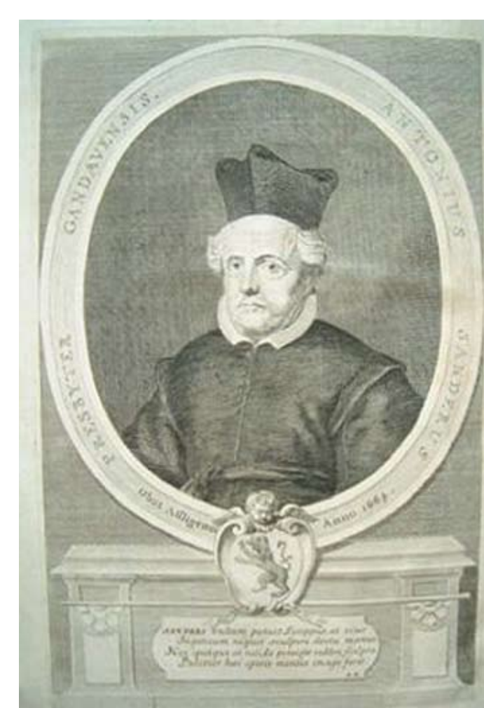
Antonius Sanderus (1586-1664), historicus, filosoof en theoloog, auteur van de 'Flandria Illustrata'