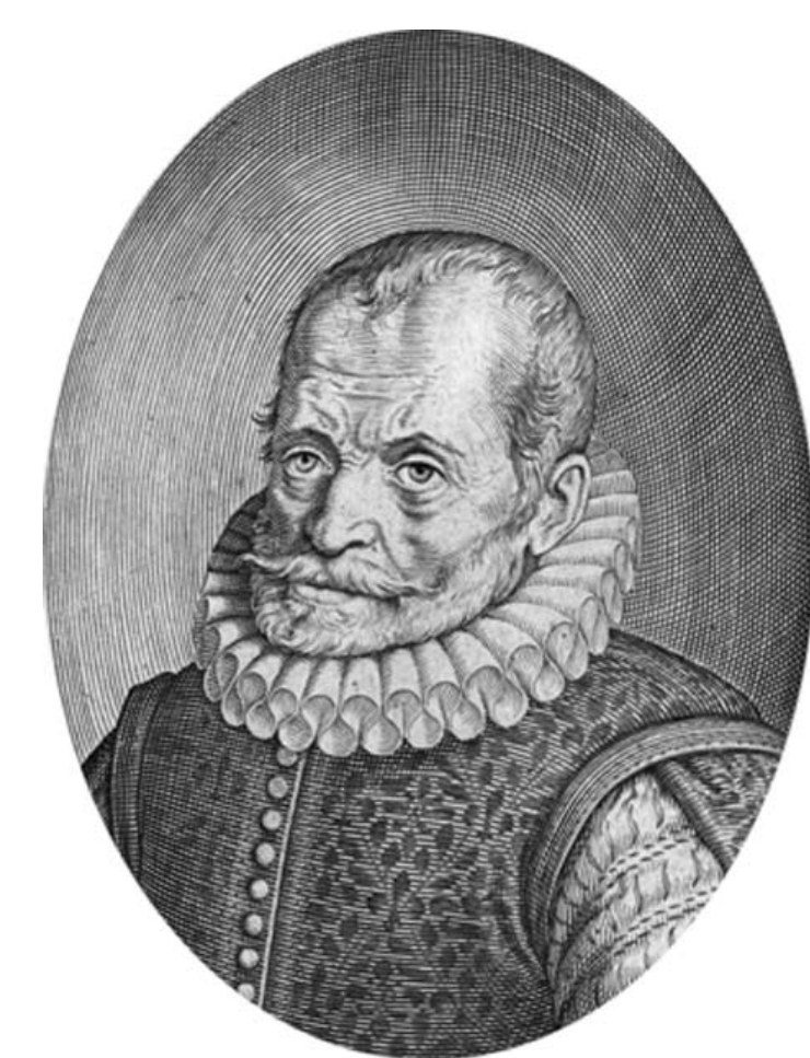
Charles de l' Ecluse ( 1526-1609), Vlaams arts, geleerde en botanicus, speelde belangrijke rol bij verspreiding van tulpen en aardappel in Europa