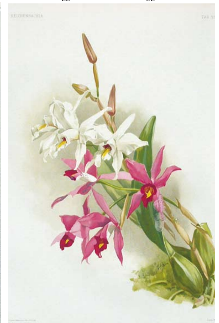
Afbeeldingen uit de Reichenbachia, de beroemde orchideeënboeken van Sander die tot stand kwamen in samenwerking met H. Moon, zijn schoonzoon. Moon tekende voor de aquarellen en stond er op de orchideeën natuurgetrouw weer te geven, terwijl de meer commercieel ingestelde Sander best vond dat een ideaal beeld meer op zijn plaats was. Een exemplaar van dit prestigieuze boek (A1 formaat) werd door Sander aan de Brugse bibliotheek geschonken.