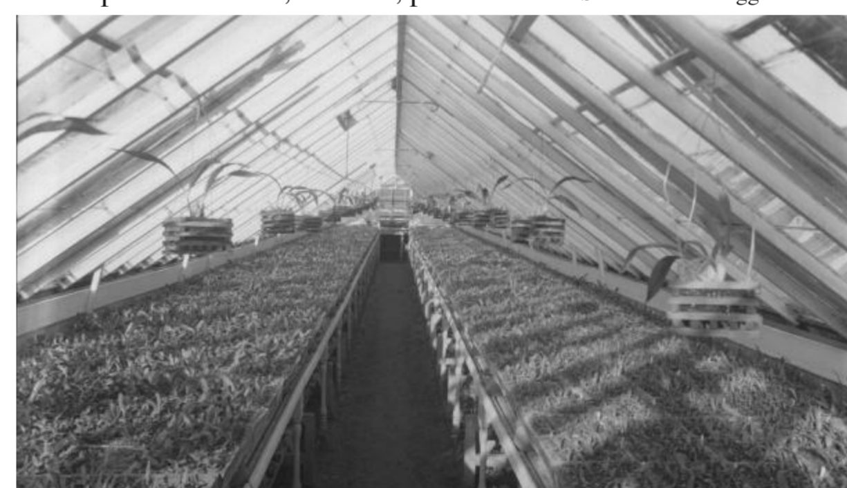
Zicht op een orchideeënserre van horticultuur Sander en Zonen .