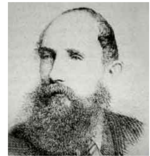
Benedict Roezl ( 1823-1885) in Praag geboren botanicus, ontdekte niet minder dan 800 orchideeën.