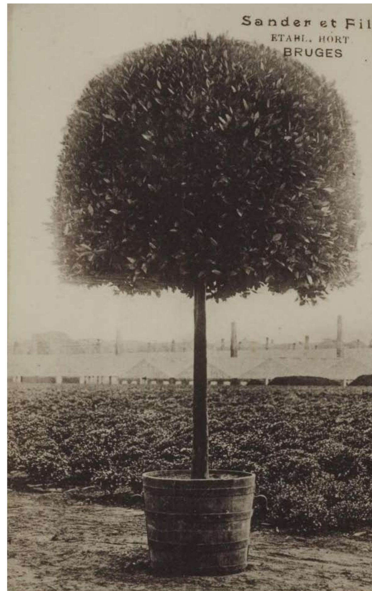
Naast orchideeën ging Sander zich ook toeleggen op de kweek en verkoop van laurieren, azalea's, palmen e.a