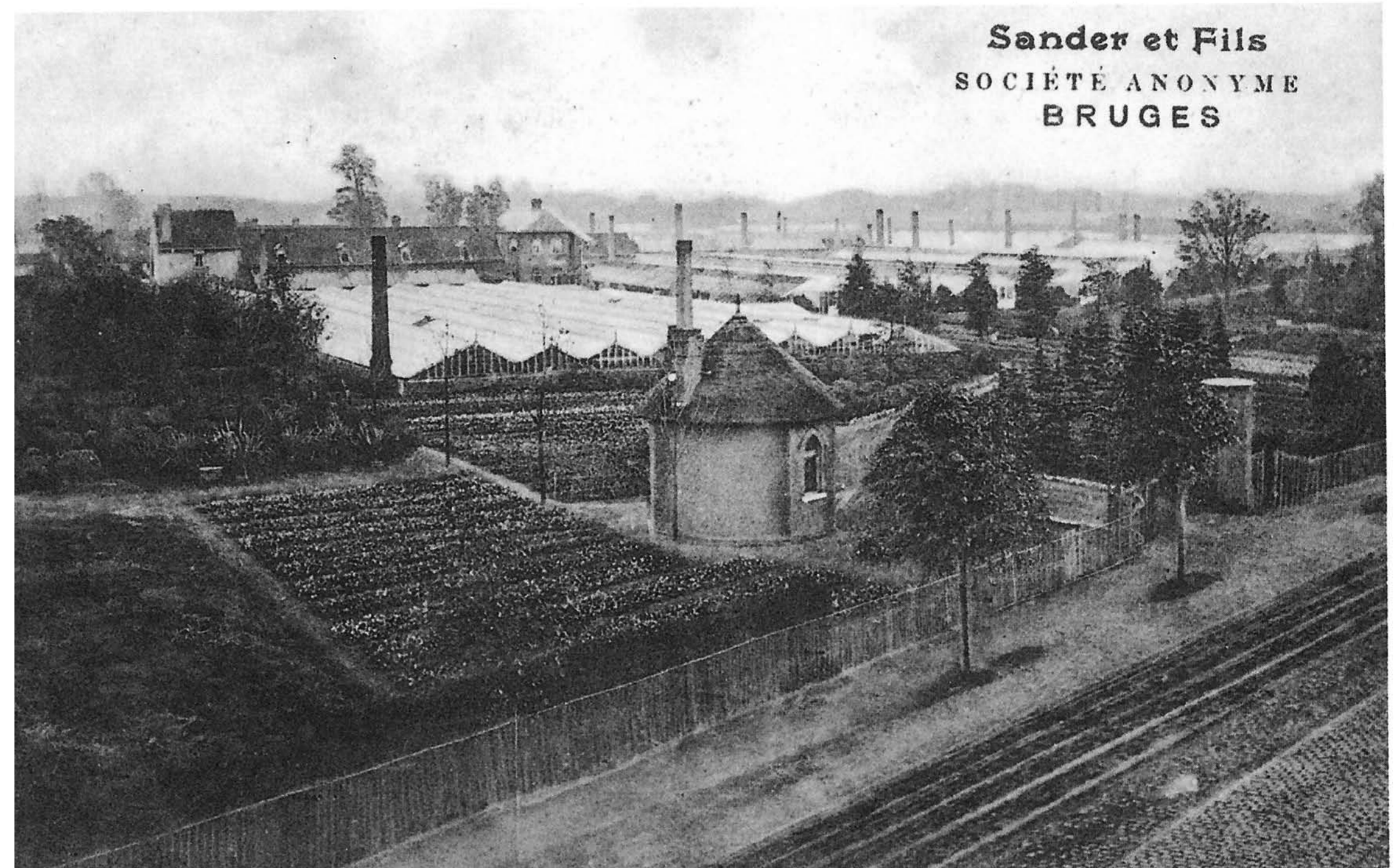
Eind 19de eeuw vestigde Frederick Conrad Sander een imposant hofbouwbedrijf te St-Andries met niet minder dan 250 serres, waarvan er 50 exclusief voor de orchideeënteelt waren voorbehouden. Op de locatie bevindt zich thans het Sanderkwartier en Sander Park, van de gebouwen bleef enkel de conciërgerie overeind, het huidige Olympia hotel. Documentatie J. Rau

De enige herinnering aan dit roemrijk verleden is de Sanderlaan en het Frederick Sanderpark te St-Andries.