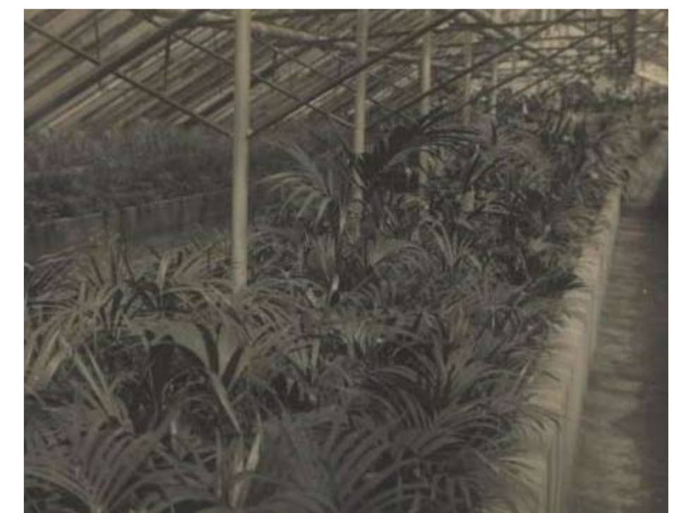
Ook bij Sander ontbreekt de razend populaire Kentia palm niet .