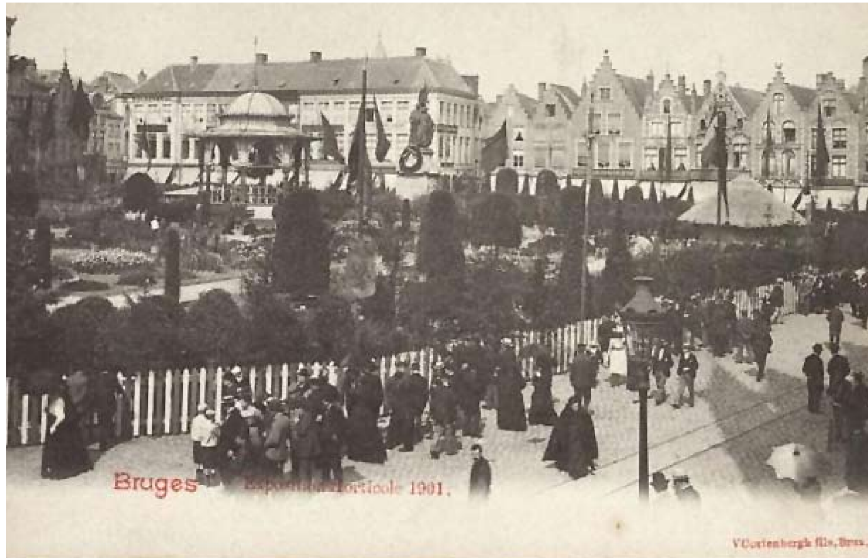
Meer volk buiten de omheining dan binnen de tentoonstelling.