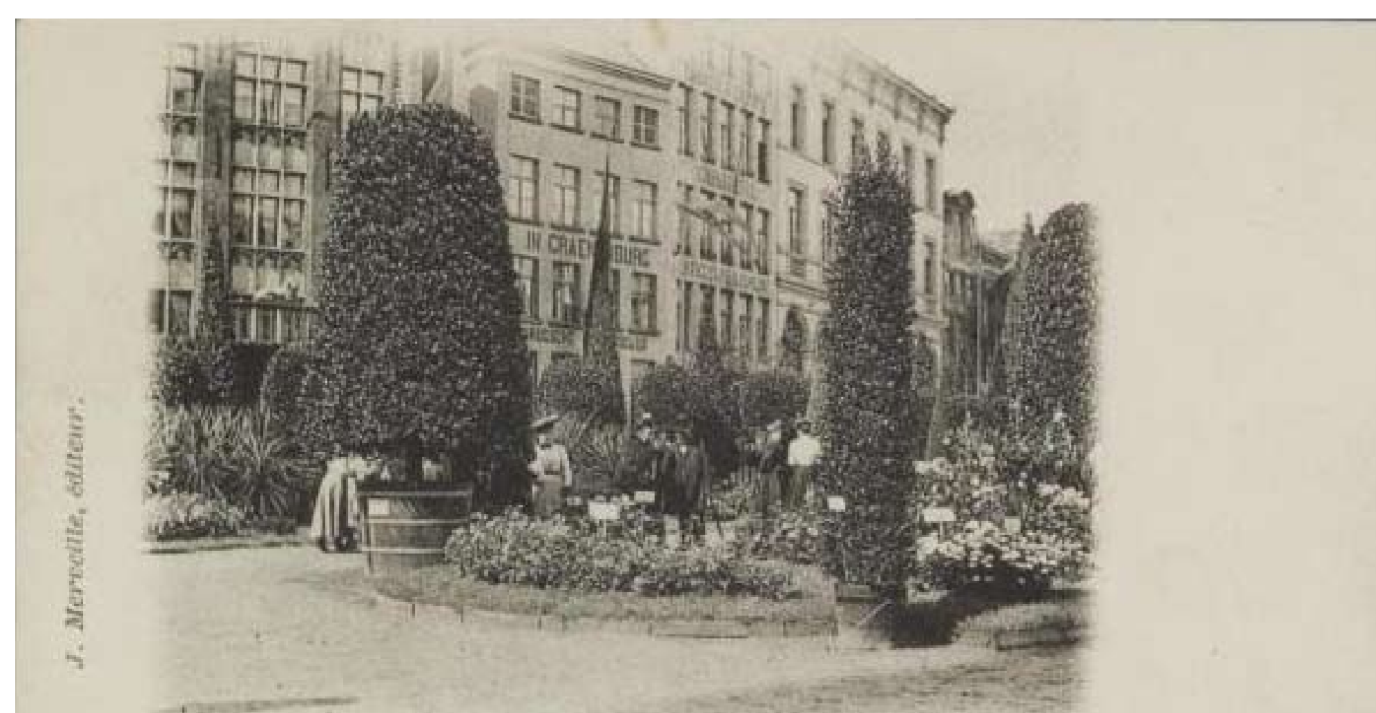
Brugse hofbouwten- toonstelling 1901, bemerk de monumentale laurieren van meer dan zes meter hoogte en 2m diameter.