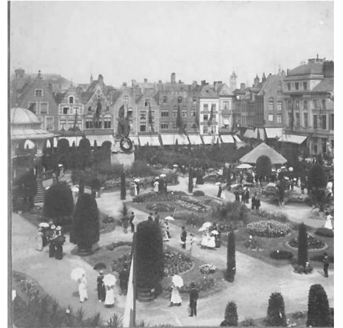
Keurige dames en heren floreren op de Brugse hofbouwten- toonstelling.