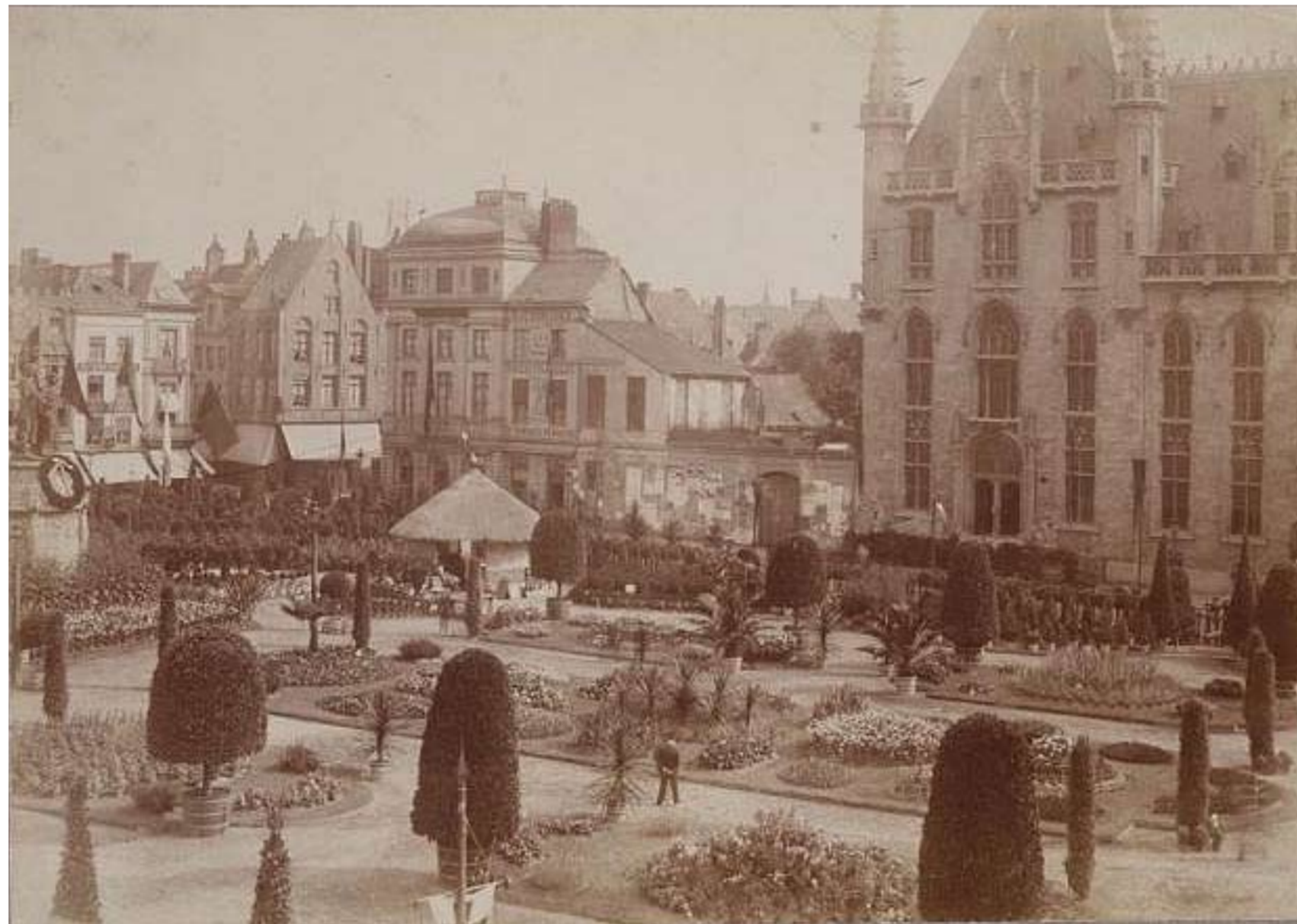
Niet alleen laurieren maar ook diverse palmbomen en bloemenperken trekken de aandacht, be- merk ook de exotische hut links op achtergrond.