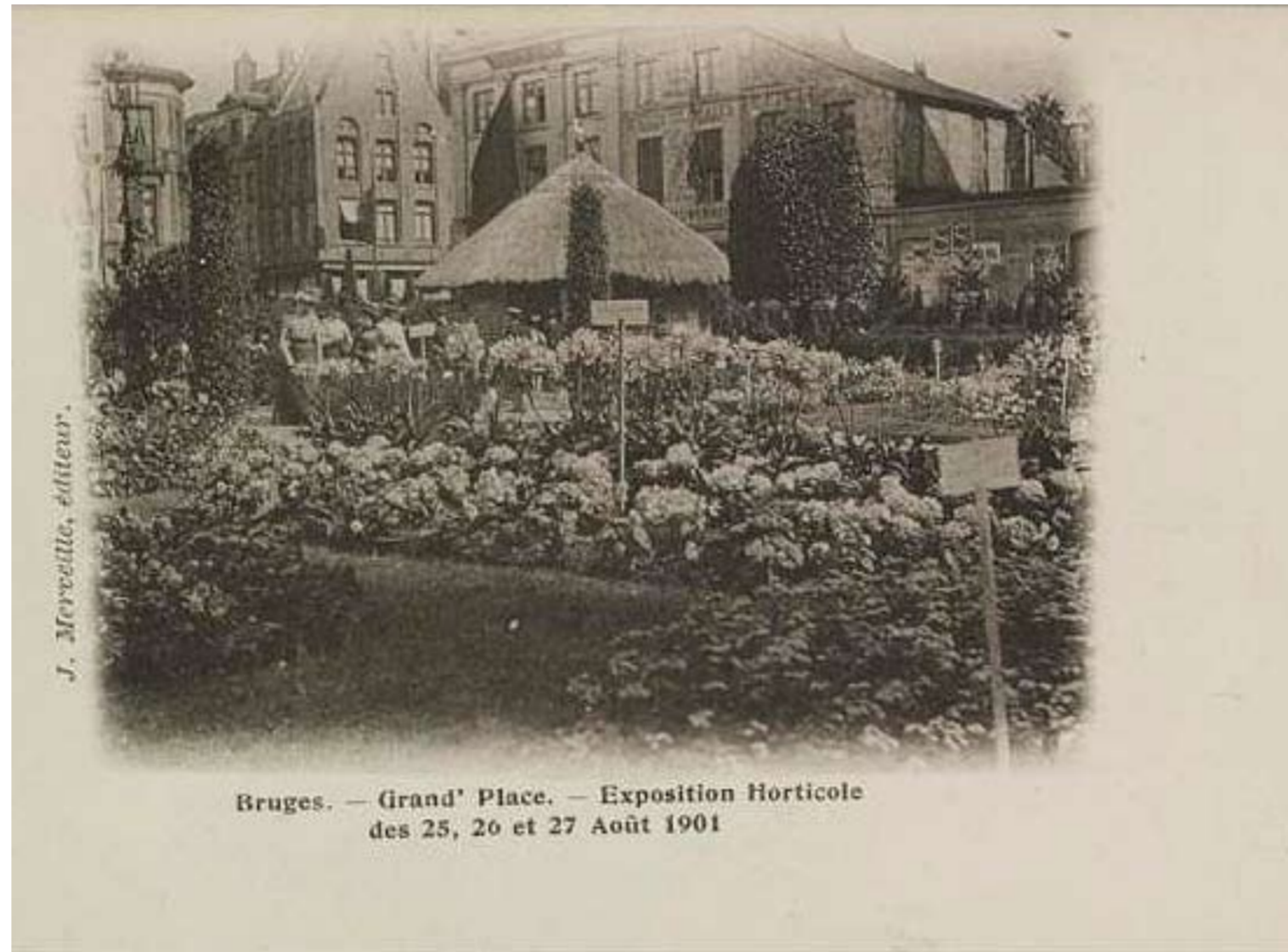
Bloemenpracht voor het exotisch paviljoen.