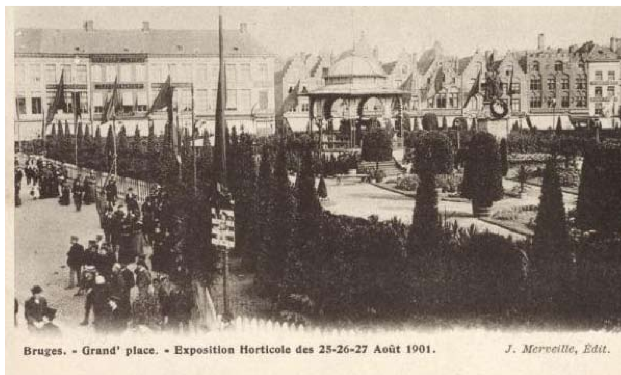
Bruges. - Grand' place. - Exposition Horticole des 25-26-27 Août 1901. J. Merveille, Édité.