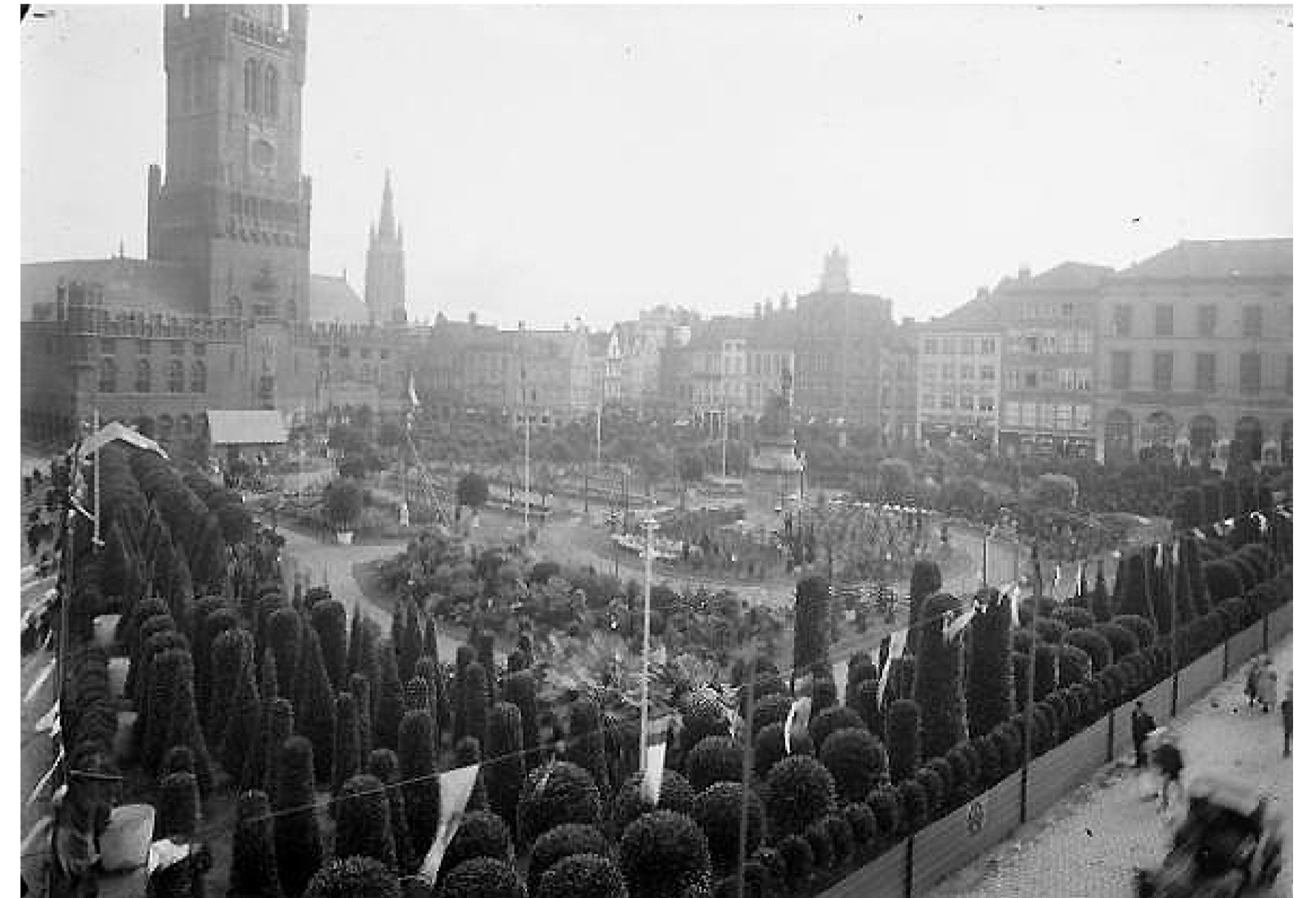
Eind 19de eeuw telde Brugge meer dan 340 kwekerijen en paktten de laurierkwekers op de markt uit met een imposant vertoon van reuze laurieren.