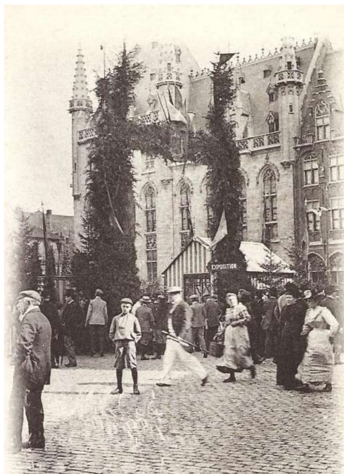
Bruges. — Grand' Place. — Exposition Horticole des 25, 26 et 27 Août 1901