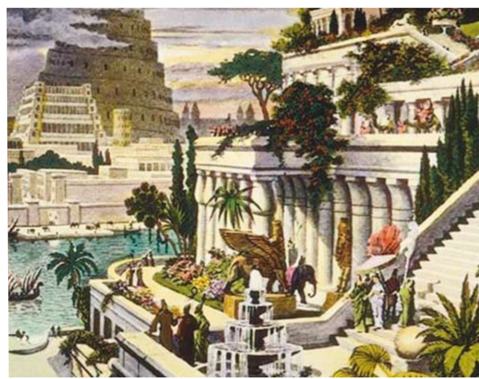
Imaginaire illustratie van hoe de hangende tuinen van Babylon er 'zouden' uitgezien hebben