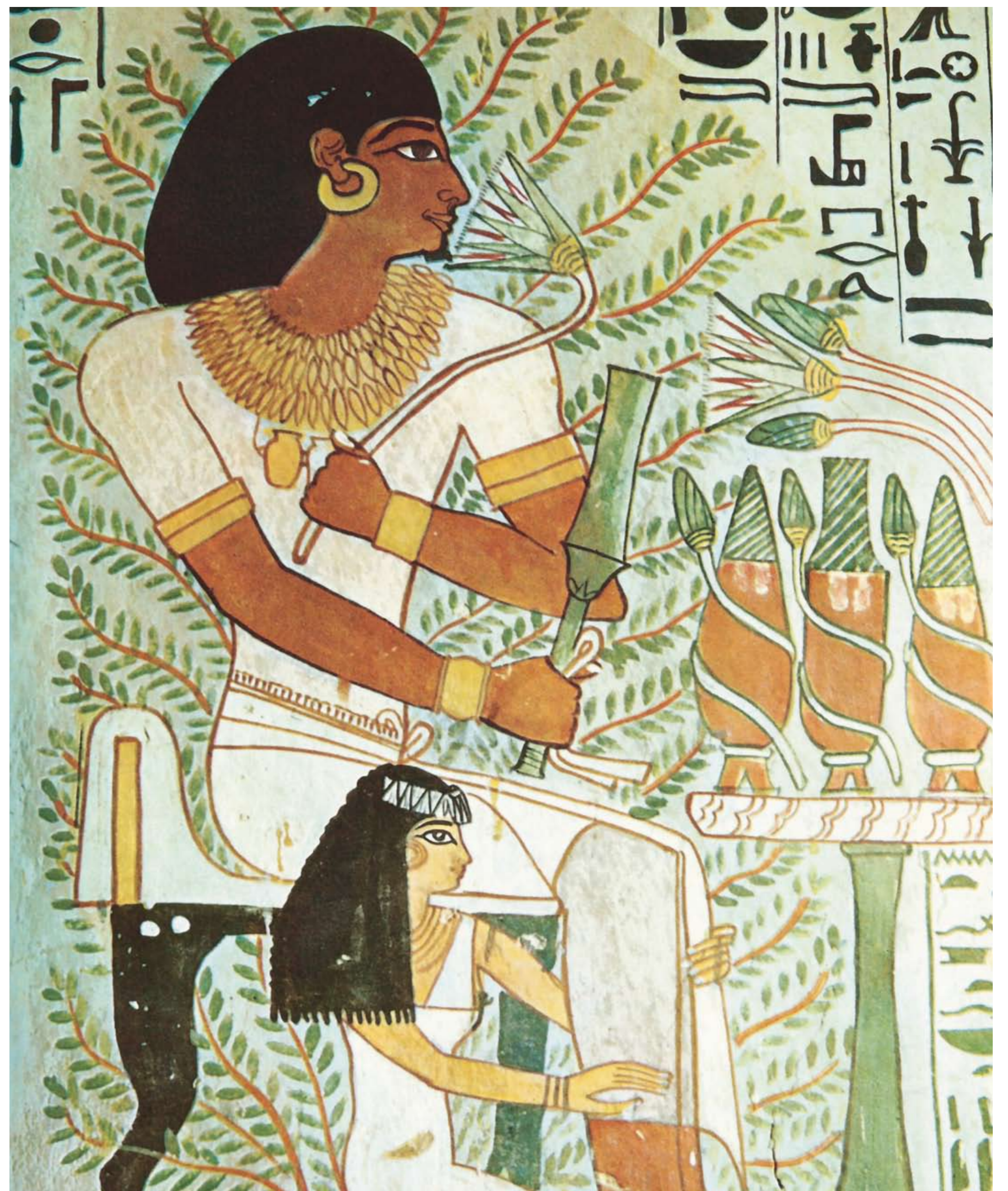
Detail van graftombe van Sennofer, bewaarder van de koninklijke parken tijdens de heerschappij van Thoetmosis III. Hij is gezeten midden van de Hemelboom wiens vruchten de goden onsterfelijkheid gaven.