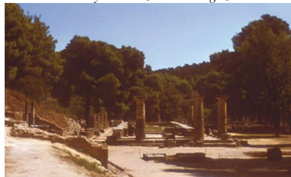
Griekse site van Olympia: griekse tuinen waren vooral ontmoetingsplaatsen, waar bomen, struiken en wandelgangen koelte bieden.