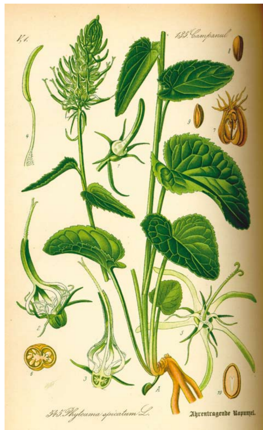
Links : Rapunzel , kruidachtige plant familie van de campanulacae - Rechts boven : Cantharel of Dooierzwam, eetbare paddestool met fijne pepersmaak. Rechts onder : vrucht van de Wonderboom (Ricinus communis)

Het gras was begroeid met wilde bloemen zoals vergeet-me nietjes, paardebloemen, boterbloemen, madeliefjes , sneeuwkllokjes en primula's. Op de door mos begroeide banken de “zodenbanken” gingen de dames zitten en vanuit het neerhof kwam de pauw aangewaggeld om zijn staart te spreiden en zich te laten bewonderen. Bij mooi weer werden ook de kooien met papegaaien en andere zeldzame vogels naar buiten gebracht. Voorname heren hielden er ook vaak een dierenpark op na. De stad Brugge bood zo aan de hertog van Bourgondië regelmatig schapen en geiten aan , om tot voedsel te dienen voor de leeuw die in het Prinsenhof werd gehouden.