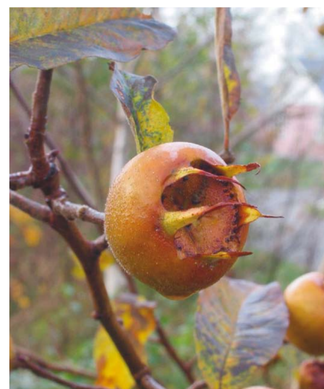
De mispel is een plant uit de rozenfamilie, verwant met appel en peer en rijk aan vitamine C, thans terug in opkomst

Als de tuinoppervlakte er de mogelijkheid tot bood werd tevens een grasmat aangelegd waarop men kon wandelen, dansen, zingen en met de bal spelen.