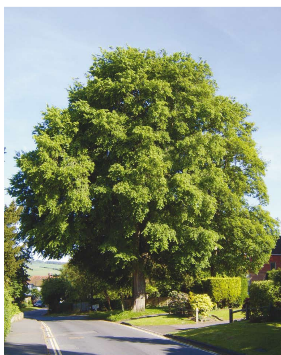
Iep (ulmus), loofboom die tot 35 m hoog kan worden, is gevoelig aan de 'iepenziekte', op een eeuw tijd verdween 90 %