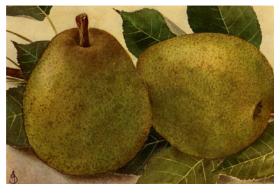
Beurré of Doyenne de Mérode, door Van Mons in 1819 naar prins de Mérode genoemd, middelgrote vruchten, wit en sappig vruchtvlees