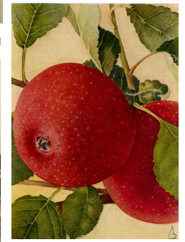
Sterappel of Sterreinet, 1830 afkomstig uit Limburg, licht rood gekleurde vrucht vlees, zachtzuur, speciaal aroma.

Onder voornamelijk Engels impuls veroveren allerlei bloemen (vaste planten, traditionele, exotische) onze tuinen, diverse nieuwe modellen van bloementuinen worden voorgesteld: 'de border, select flower garden, changeable flower garden en de botanic flower garden'. Ook rozen komen erg in de mode, door de import van rozen uit China (Rosa Chinensis) die langer bloeien en de hieruit gekweekte hybriden ontstaan talloze nieuwe variëteiten. Het tijdperk van de rozenveredelaars breekt aan. In diverse steden worden ook plantentuinen opgericht (Gent- Leuven- Luik- Antwerpen), de 'hortus Gandanensis' wordt het eerste tuinbouwcentrum van België. De Gentse plantentuin trekt botanici, apothekers, boomkwekers aan die er planten komen bestuderen en soms stekken verkrijgen van de meer dan 2000 aanwezige plantenvariëteiten. De Gentse tuinbouw onder impuls van pionier Louis van Houtte (1810-1876) zorgt voor een bloeiende handel van exotische soorten zoals azalea's, camelia's en begonia's. In Wetteren daarentegen ontstaat onder impuls van Adolphe Papeleu (1811-1859) de grootste Belgische Boomkwekerij voor fruit –en sierbomen. Wanneer hij in 1874 zijn bedrijf sluit nemen zijn werknemers de fakkel over en staan zo aan de wieg van de ook heden ten dage nog belangrijke Wetterse boomkwekerij sector.