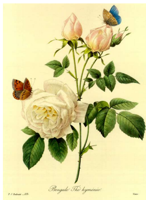
Botanische illustraties van Pierre-Joseph Redouté (1759-1840) geboren in 1759 in Saint-Hubert in België. Maakte zich een eigen techniek meester, bijgenaamd de 'stippeltechniek' en werd ook vaak 'le Raphaël des fleurs' genoemd.