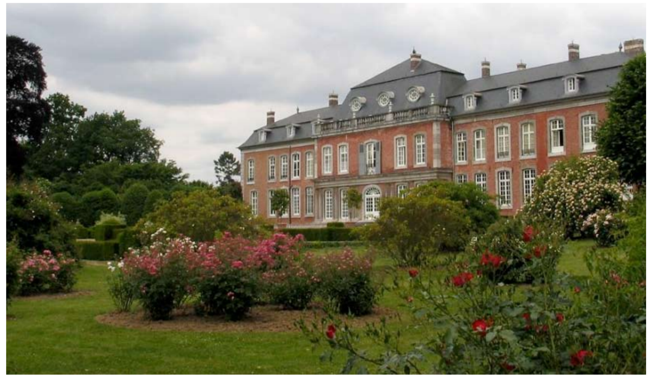
Kasteel van Hex: u-vormig kasteel in Rococo Stijl met Engelse invloeden, vooral bekend omwille van zijn prachtige rozencollectie.