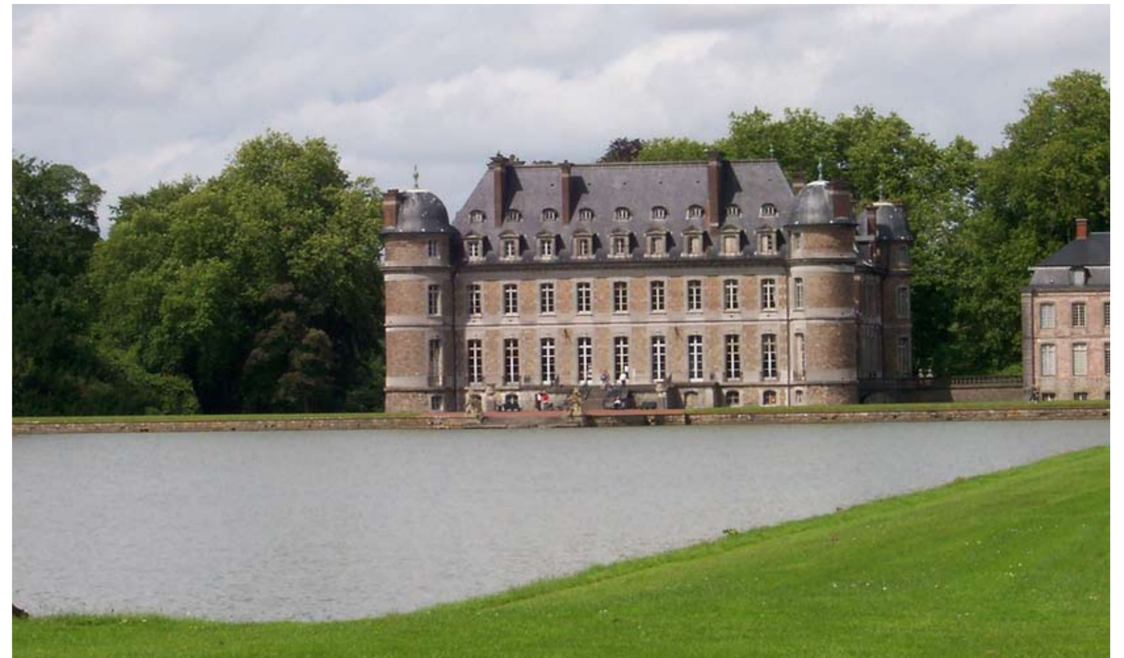
Kasteel van Beloeil, residentie van de prince de Ligne bevat een schitterende Franse tuin met romantische invloeden uitgestrekt over 25 ha.