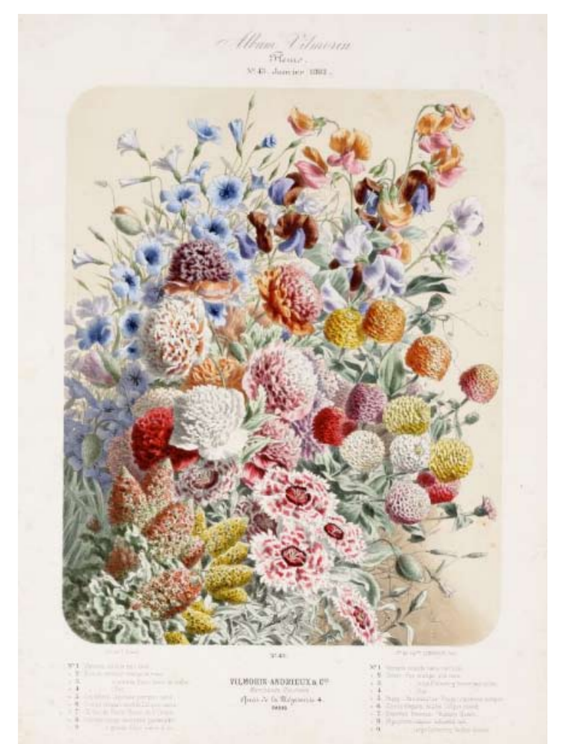
Prachtige illustraties uit de catalogi van Vilmorin. Ook heden ten dage behoort Vilmorin tot de top producenten van zaden. Bij deze firma zijn ook nu nog heel wat (heerlijke) oude rassen te verkrijgen.